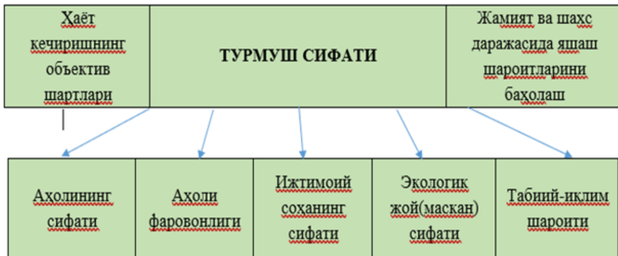
1-расм. Турмуш сифати ва уни оширишга таъсир этувчи омиллар

Ижтимоий соҳанинг таркибий қисмлари турли даражадаги мураккабликларга эга, иерархик боғлиқликда бир-бирига нисбатан ва яхлит тизим сифатида ижтимоий соҳадан олинган. Уларнинг ўзига хослиги, пайдо бўлиши ва мавжудлиги ижтимоий соҳанинг асосий функцияси - одамларнинг ижтимоий такрор ишлаб чиқариш функцияси, ҳаёт субъектлари ва тузилмаларни, ижтимоий институтларни, ижтимоий субъектларнинг ҳаётини қўллаб-қувватлаш манбаларини тиклаш функцияси билан белгиланади. Ижтимоий инфратузилма моддий муҳит ва ижтимоий субъектларнинг ўзаро таъсир доираси бўлиб, уларнинг ҳаёти ва фаолиятини оқилона ташкил этиш учун шароит яратади. Ўзининг ички ташкилотига кўра, ижтимоий соҳа инфратузилмаси барча ижтимоий