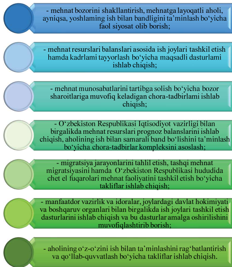
2-rasm. O'zbekiston Respublikasi Bandlik va mehnat munosabatlari vazirligining aholini ish bilan bandligini ta'minlashdagi asosiy vazifalari 1

Mehnat resurslari va ish kuchi sifatiga ta'sir ko'rsatuvchi muhim ko'rsatkich -ularning kasbiy-malaka tarkibi hisoblanadi. Har bir alohida holatda mehnat resurslarining kasbiy-malaka tarkibi ta'lim va kasbiy tayyorgarlik tizimi bilan belgilanadi. Mehnat qilayotgan ish kuchi sifatini baholashda (ayniqsa, o'tish davrida) uning kasb va hududiy harakatchanligi darajasi tobora ortib borish muhim ahamiyatga egadir. Bu daraja qator xususiyatlar: milliy an'analar, bozor infratuzilmalari rivojlanganligi darajasi, turar joy bozori mavjudligi bilan belgilanadi. Aholining ish bilan bandligi darajasini shakllantirishga mehnat qonunchiligi ham bevosita ta'sir ko'rsatadi. Ishsizlikni tartibga soluvchi huquqiy hujjatlar (ishsizlikni aniqlash, mazkur maqomni olish tartibi, ishsizlik aniq shakliga bog'liq ravishda statistika hisobotini olib borish xususiyatlari) davr talabi asosida muttasil takomillashtirib borilishi lozim. Jumladan, hozirgi paytda ishsizni ro'yxatga olish bosqichidayoq tegishli yo'riqnomalarning mukammal emasligi sezilib qoladi. Natijada, Ish bilan bandlikka