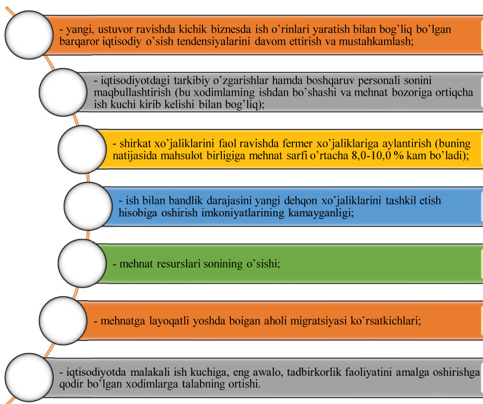
3-rasm. O'zbekiston Respublikasida ish bilan bandlikni shakllantirish va mehnat bozoriga ta'sir etuvchi omillar 1

Mehnat bozori, bandlik, demografiya, mehnat migratsiyasi, malaka tizimi va kasbiy standartlarni takomillashtirish va mehnatni muhofaza qilish yo'nalishlarida ilmiy-amaliy ishlar, tadqiqotlarni amalga oshirish hamda erishilgan ilmiy natijalarni amaliyotga keng joriy etish va sohada ilmiy salohiyatni oshirish maqsadida, Respublika bandlik va mehnat muhofazasi ilmiy markazi Mehnat bozori tadqiqotlari instituti etib qayta tashkil etildi.