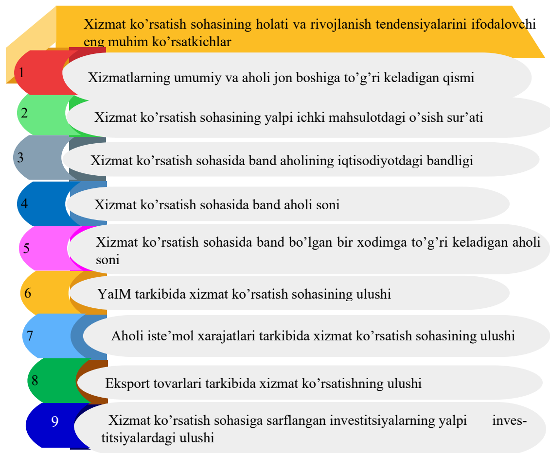
1-rasm. Xizmat ko'rsatish sohasining holati va rivojlanish tendensiyalarini ifodalovchi eng muhim asosiy iqtisodiy ko'rsatkichlar*

larini ifodalovchi eng muhim asosiy iqtisodiy ko'rsatkichlar tarkibiga quyidagilarni kiritish mumkin (1-rasm).