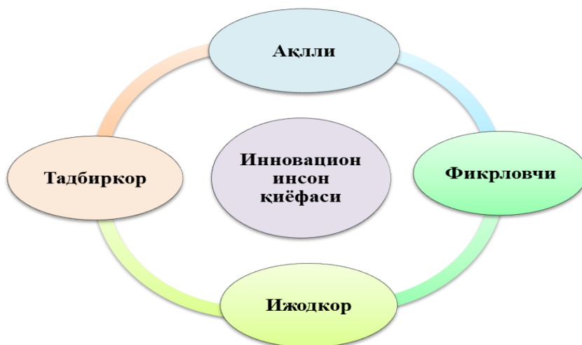
2-расм. Инновацион инсоннинг «АФИТ» қиёфаси

Бизнинг фикримизча, шахснинг инновативлик хусусиятини ифодаловчилари сифатида оқиллик, фикрловчилик, ижодкорлик ва тадбиркорлик фазилатлари хизмат қилиши мумкин. Биз инновацион инсоннинг “Ақлли, фикрловчи, ижодкор ва тадбиркор (қискартирилган – “АФИТ”) қиёфасини яратишни тавсия қиламиз (2-расм).