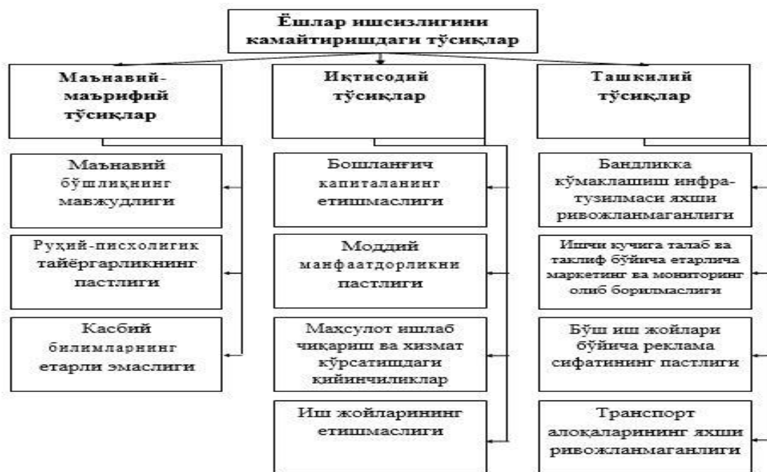
3–расм. Ёшлар ишсизлигини камайтиришдаги тўсиқлар

мингдан ортиқ бўлиб, туғилиш коэффициентини 20,9 дан 22,4 промиллега оширди [11].